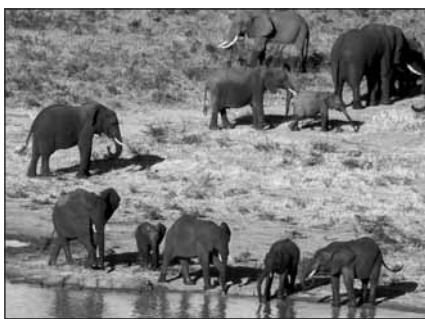
Сотрудники Национального парка Цаво ежедневно рискуют жизнью, спасая слонов, таких как эти.

Партнерство IFAW и Службы дикой природы Кении приносит свои плоды. На средства наших спонсоров сооружена электрическая изгородь между западным участком парка Цаво и селением Тавета для защиты ферм от мигрирующих слонов. С помощью своих сторонников IFAW приобрел патрульные автомобили, компьютеры, GPS-системы, радио; оборудован базовый лагерь, повышающий мобильность и мощность охраны, а также моральное состояние штата. Служители парка усилили его охрану; им удалось задержать 20 браконьеров и конфисковать рога носорогов, слоновую кость, три тонны сандалового дерева и огнестрельное оружие. В мае три охранника были убиты в перестрелке с браконьерами. Это печальное происшествие – еще один аргумент в пользу критической необходимости улучшить охрану Национального парка Цаво в интересах как животных, так и людей.