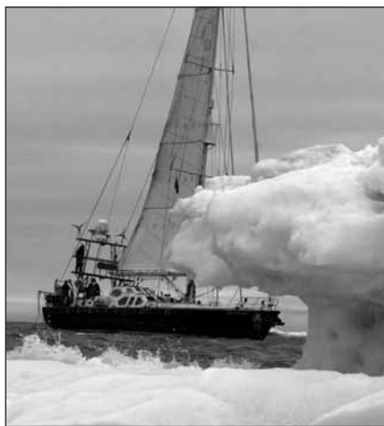
Прошлым летом команда "Песни кита" провела два месяца в Исландии, демонстрируя методы исследований китов, не наносящие вреда животным

ученые некоторых стран работают в штате специалистов IFAW. Посетите http://blog.stopwhaling.org/ чтобы узнать о дальнейших путешествиях "Песни кита".