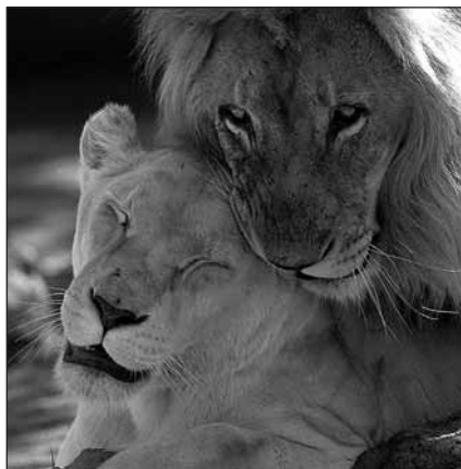
IFAW выступает против потребительского отношения к дикой природе в Кении и где бы то ни было. Мы за экотуризм, общественное владение и справедливое распределение прибыли от природных ресурсов, щадящие методы управления дикой природой.

тия запрета. "Охотясь, мы теряем – сохраним их живыми!" – призывали кенийцев транспаранты, плакаты и календари в Найроби. Многие выразили свое несогласие с практикой потребительского отношения к дикой природе путем публичных демонстраций и петиций правительству.