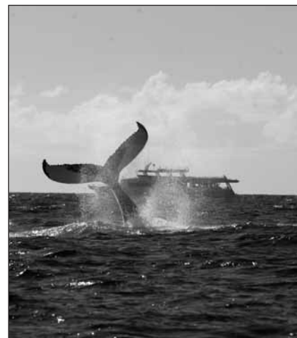
В Латинской Америке растет интерес к наблюдению за китами

рамках стран Латинской Америки по сохранению китов.