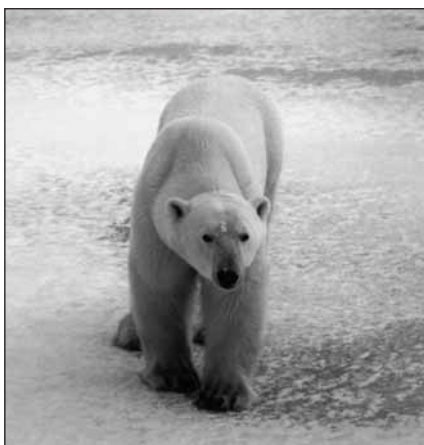
Белым медведям, жертвам охотников за трофеями, в настоящее время угрожает глобальное потепление.

IFAW настаивает, чтобы Служба управления ресурсами рыб и дикой природы США включила белых медведей в список видов, находящихся под угрозой исчезновения, и рекомендует Конгрессу США внести поправки о запрете импорта "охотничьих трофеев" – шкур и голов белых медведей – в Акт по защите морских млекопитающих от 1972 г. Импорт тюленевых шкур уже запрещен.