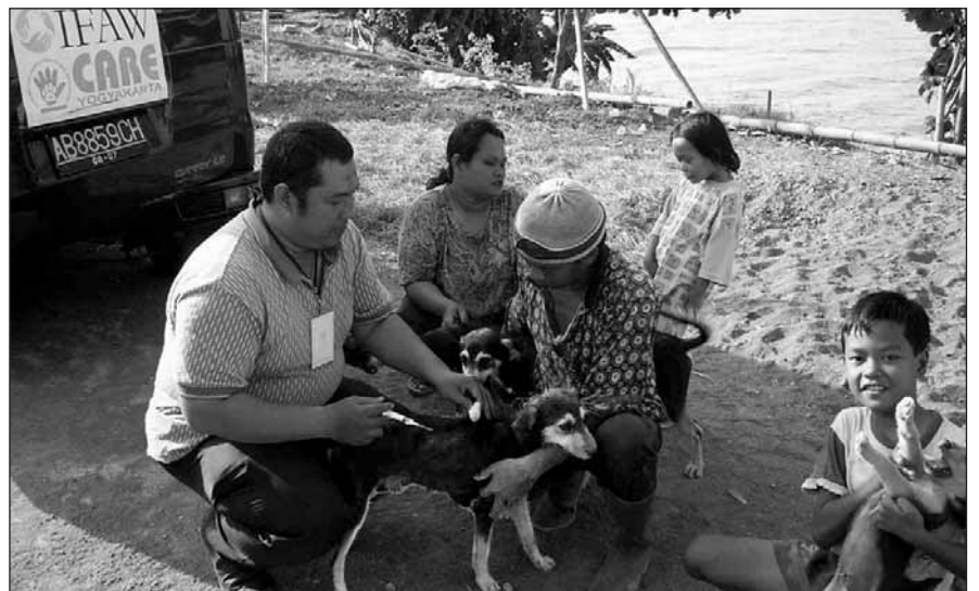
IFAW и местная индонезийская группа CARE обследовали домашних и сельскохозяйственных животных, пострадавших на Яве во время цунами