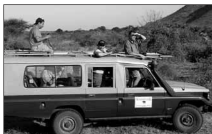
Доноры IFAW на сафари-2005 в Национальном парке Меру (Кения) получили незабываемые впечатления

Совершите незабываемое путешествие с IFAW! Станьте очевидцем дикой жизни и настоящих чудес всемирно известных национальных парков Кении, насладитесь роскошными условиями проживания, и уникальными впечатлениями вместе с экспертами IFAW по дикой природе Восточной Африки и сотрудниками Службы дикой природы Кении! Ни одна другая компания сафари